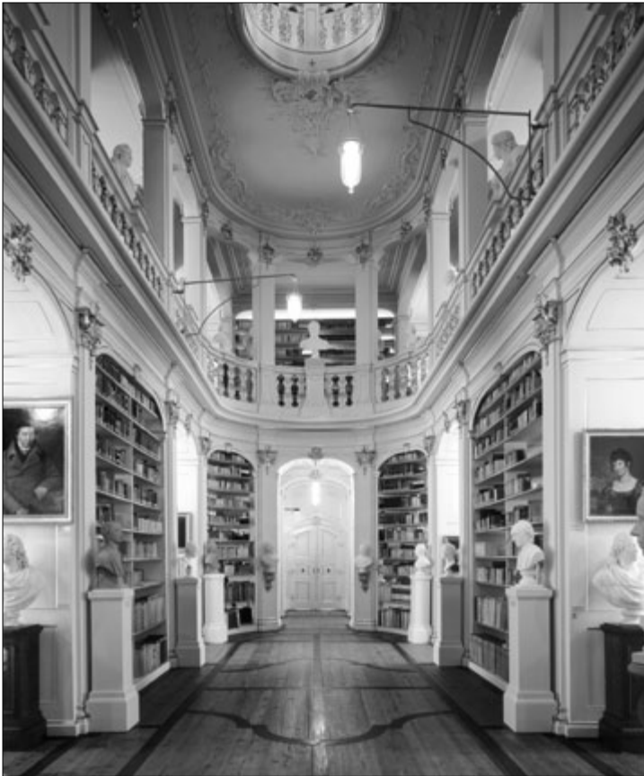
Rokkosaal der Herzogin Anna Amalia Bibliothek in Weimar.