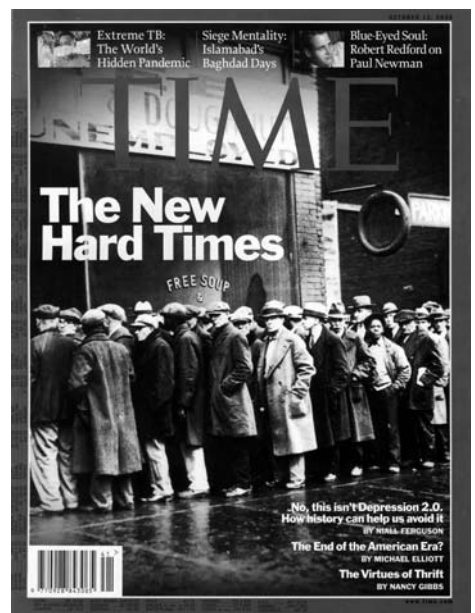
Es gibt eine Krise, es gibt keine Krise, es gibt doch eine Krise. Umschlagtitel von Time, Figaro Magazine und The Economist aus dem Oktober 2008.